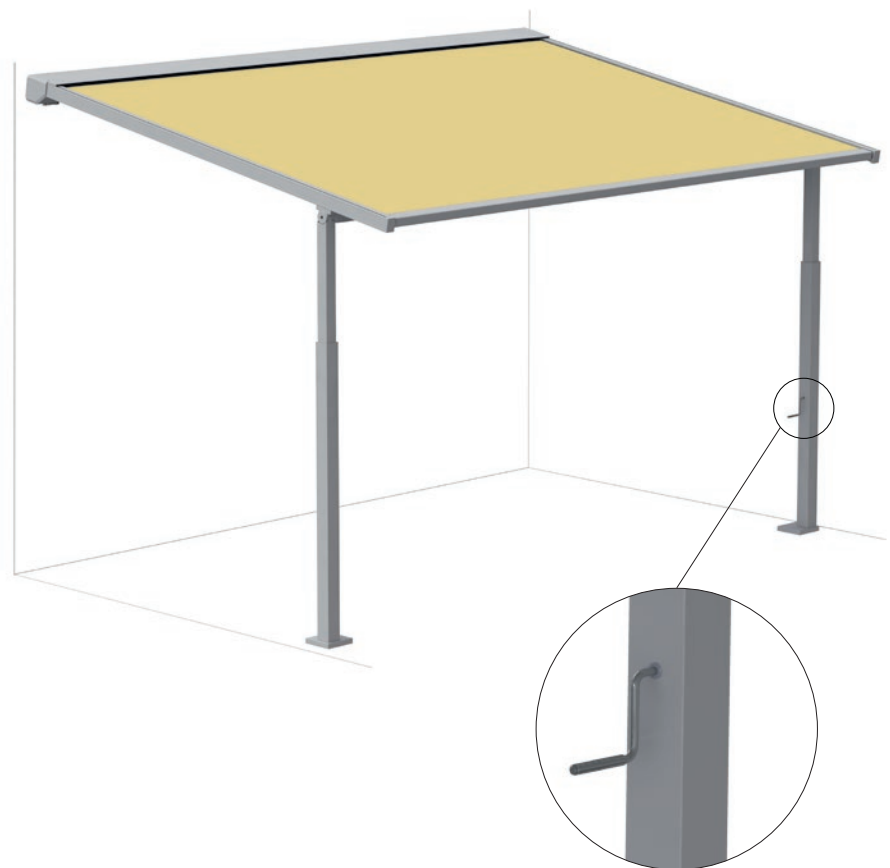
Optional absenkbare Säule