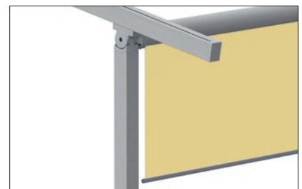
Optional Varioplus-Rollo (motorbetrieben)