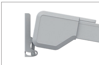
Kastendesign ELEGANZA 253 mm x 156 mm