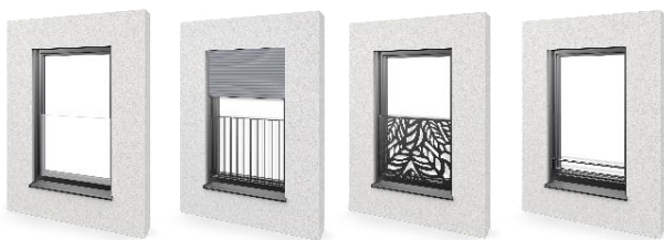
Bild 1, Bilduntertitel: Maximale Sicherheit in vielfältigen Designs: Mit den integrierten Glas-, Gitter-, Platten und Stangenlösungen lassen sich ab sofort sowohl klassische, elegante als auch kreative Fassadenakzente setzen.