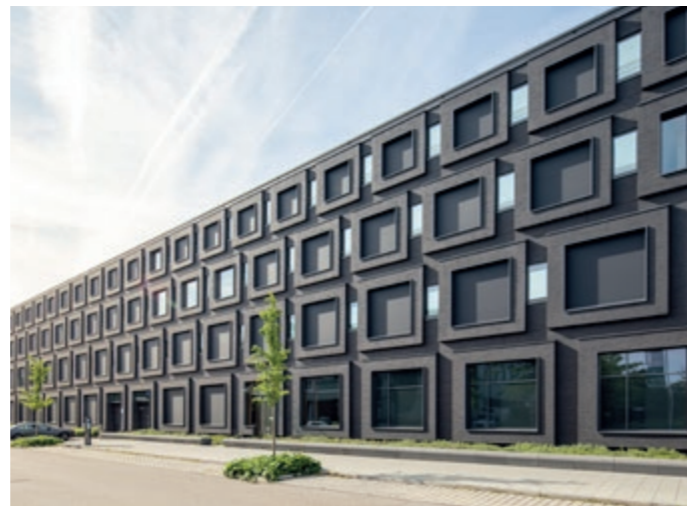
Finestre e facciata