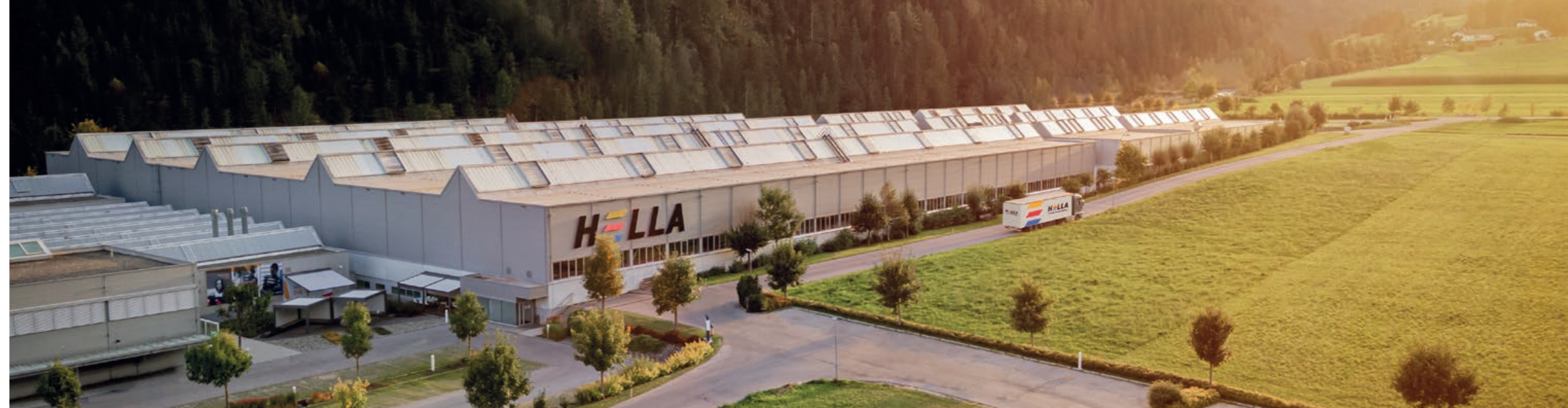
Die HELLA Zentrale und das Werk in Abfaltersbach, Osttirol