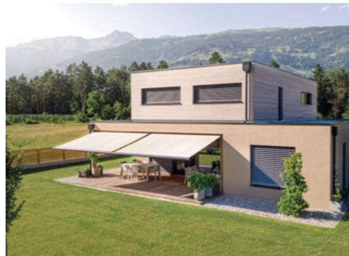
Terrasse & Garten