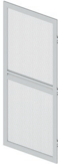
ISD E Drehrahmen einfach