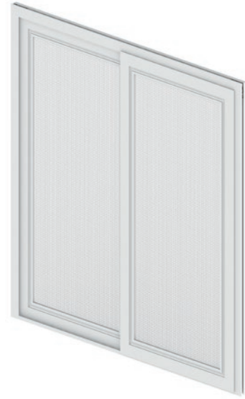
IST Z Schieberahmen mit Zarge